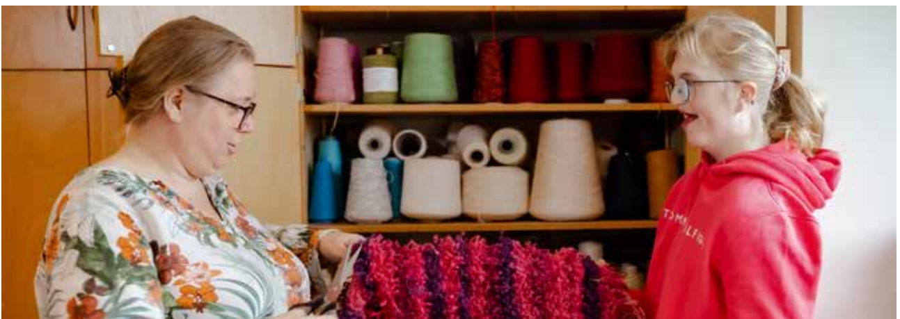
Sandra Tesselaar met een van de makers